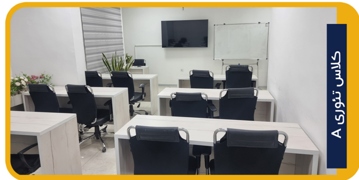
کلاس تئوری A

شرکت هرم علم کوشا با هدف فراهم آوردن امکان ارائه خدمات برتر در برگزاری دوره های آموزشی، در بالاترین سطح ممکن، فضاهای آموزشی خود را در اختیار کلیه ی متقاضیان بخش خصوصی و دولتی قرار می دهد، این مرکز با دارا بودن سالن های آموزشی متنوع، تجهیزات مدرن صوتی و تصویری و خدمات ویژه تشریفات و پذیرایی، تا کنون مجری برگزاری شمار زیادی از دوره های آموزشی در سطح منطقه بوده است.