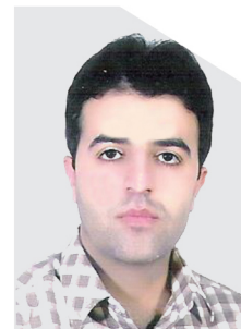
★★★★★ دکتر سلیمانے حوزه : بهداشت