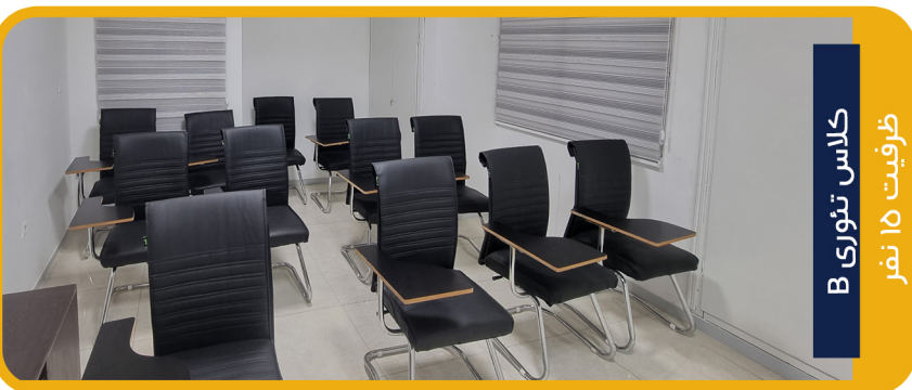
کلاس تئوری B