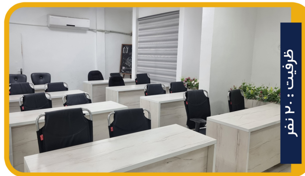
ظرفیت : ۲۰ نفر